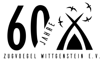
ZUGVOEGEL WITGENSTEIN E.V.