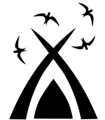
Zugvögel Wittgenstein e.V.